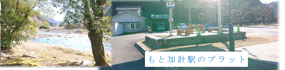
もと加計駅のプラット