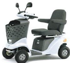
NEW プリリアントホワイトパール (YUH)

メーカー希望小売価格 ※2 380,000円 (セニアカーには、消費税がかかります。)