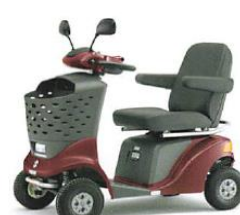
メタリックレッド (ZBZ)