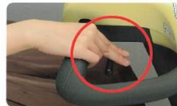
(押し下げると動き出す)

ハンドル内側のアクセルレバーを押し下げればモーターが作動して動き出します。そして手を放せば、アクセルレバーが元の位置に戻り、自動でブレーキがかかります。セニアカーはアクセルレバー一本で、アクセルとブレーキの操作ができます。