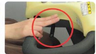
(放すとブレーキがかかる)